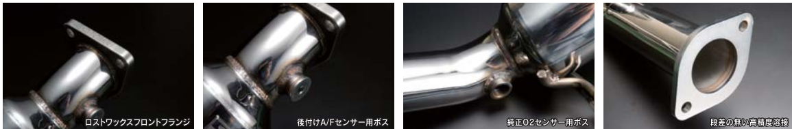
ロストワックスフロントフランジ